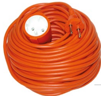
PS27 - PS28