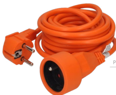
PS040 - PS17