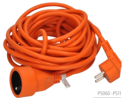
PS060 - PS11