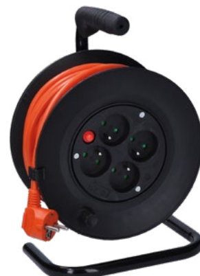
PB230 - PB04