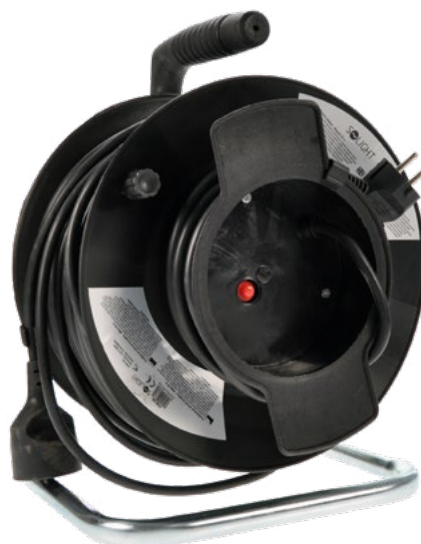
PB11 - PB12