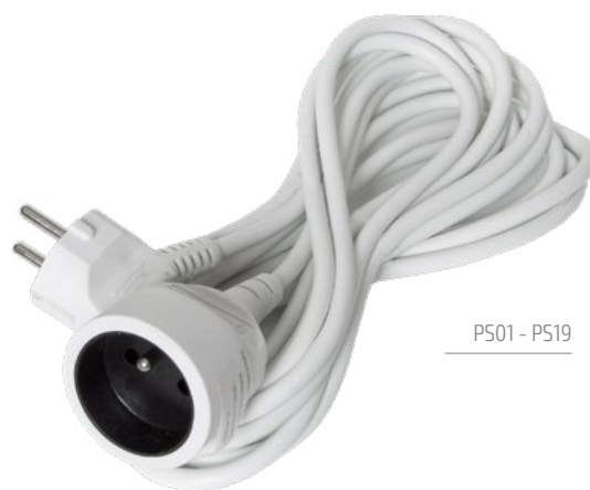
PS01 - PS19