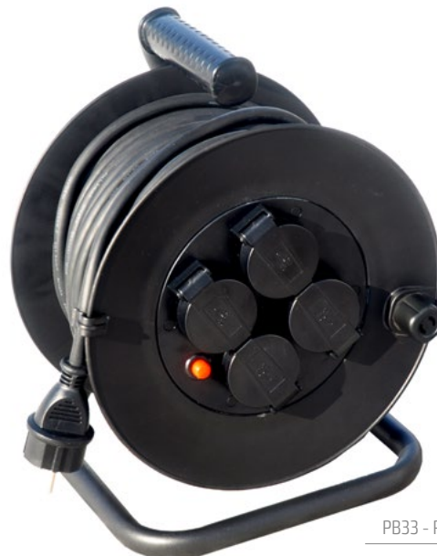
PB33 - PB34