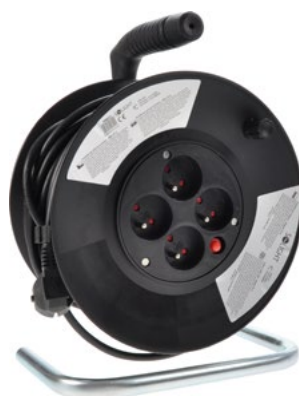
PB01 - PB02