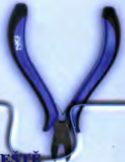
KLEŠTĚ PRO ELEKTRONIKY