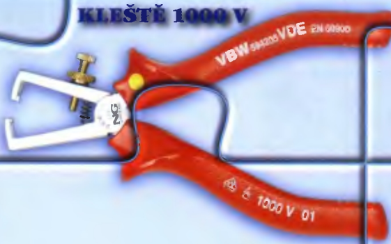
KLEŠTĚ 1000 V