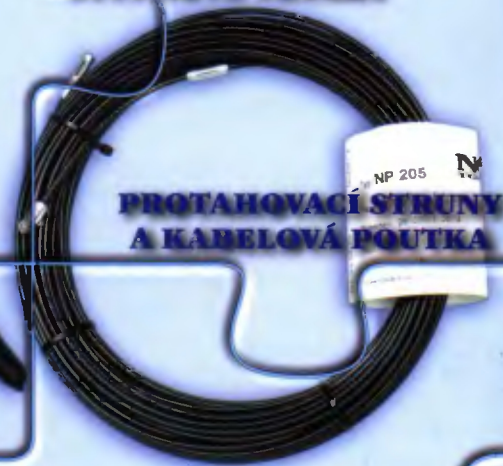
PROTAHOVACÍ STRUNY A KABELOVÁ POUTKA